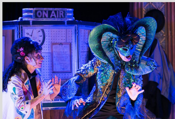
La compagnie Oz se produira au collège durant cette semaine