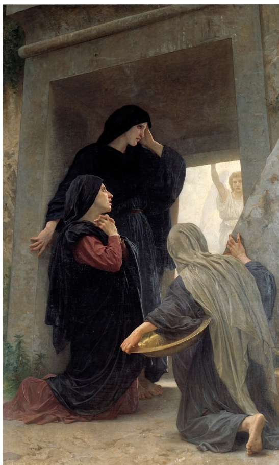
William Bouguereau (1825-1905) Les saintes femmes au tombeau , 1876, huile sur toile, 259 X 161 cm, Musée royal des Beaux-Arts d'Anvers

Le mot de l'APEL Agenda et infos diverses