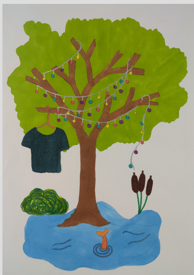
Illustration, Alma Malinowski, 4 e 2