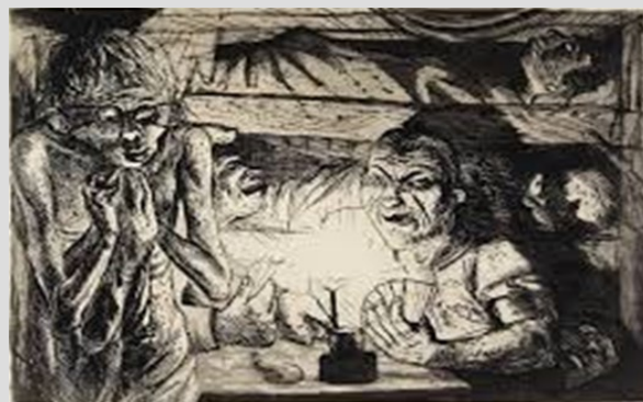
Otto Dix, Der Krieg (1924)