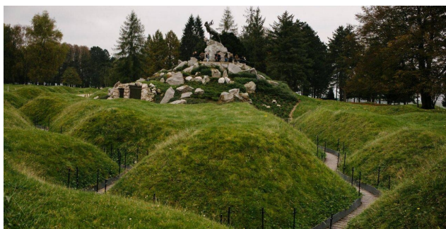
Mémorial terre-neuvien de Beaumont-Hamel