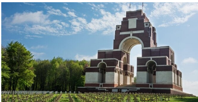
Cimetière français et mémorial britannique de Thiepval