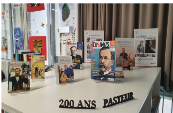
Kiosque au CDI

A l'occasion de l'anniversaire de la naissance de Pasteur, le CDI propose un kiosque avec journaux et documents sur la vie du célèbre scientifique. Vous pourrez également découvrir une exposition en 11 panneaux retraçant les grandes étapes de sa carrière devant les laboratoires de SVT, au deuxième étage.